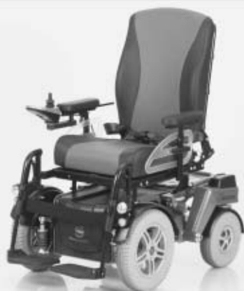
Elektrorollstuhl C1000 DS