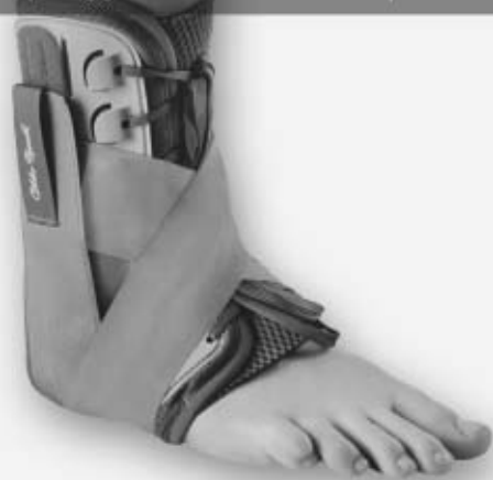
Sprunggelenkorthese Malleo Sprint